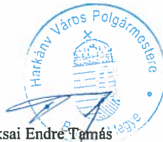
Baksai Endre Tamás Polgármester