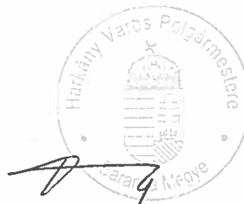
Baksai Endre Tamás polgármester