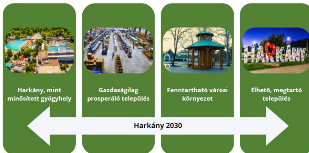
1. ábra Harkány jövőképének elérését szolgáló átfogó célkitűzések